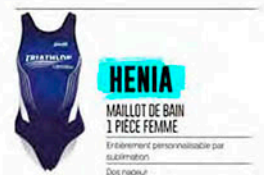
HENIA MAILLOT DE BAIN 1 PIECE FEMME

Entièrement personnalisable par sublimation Dos rigide Matière respirante et compressive XTENS-ELITE™ DWR FluorFREE Bassin sans à-vis couture Option (avec ou sans chemisière)